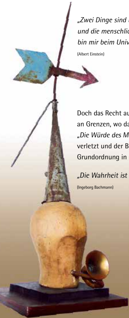
Falscher Prophet Objet Trouvé, 2020

Habt MUT , steht auf! für DEMOKRATIE und MENSCHENWÜRDE