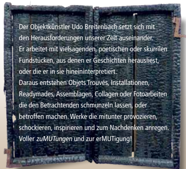
Sie sollten nicht immer nur SCHWARZ sehen! Objekt Trouvé, 2022