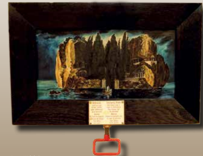
Letzte Wahrheit Objet Trouvé, 2021

„Nicht alle von uns können große Dinge tun. Aber wir können kleine Dinge mit großer Liebe tun.“ (Mutter Theresa)