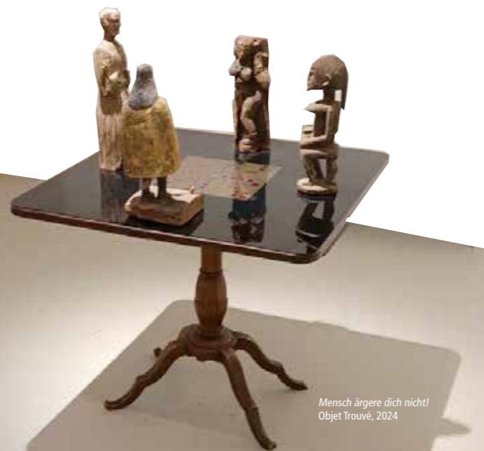
Mensch ärgere dich nicht! Objet Trouvé, 2024

Konflikte fangen dort an, wo die Toleranz aufhört. Sie ist unabdingbar für den gesellschaftlichen Zusammenhalt. Eine pluralistische demokratische Gesellschaft ist ohne das aktive Eintreten für Toleranz nicht möglich.